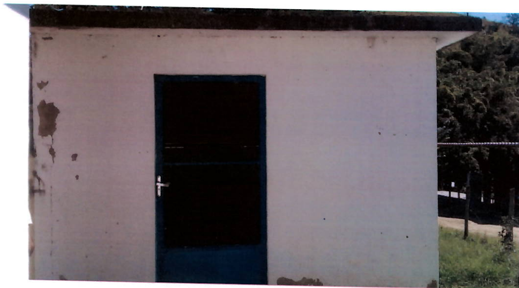
Vista frontal do abrigo da EAT da ETA Fazenda da Grama.

Está localizada na estrada Severino Campos Oliveira nº 1925 Fazenda da Grama. Coordenadas(-22.659988, -44.051382).