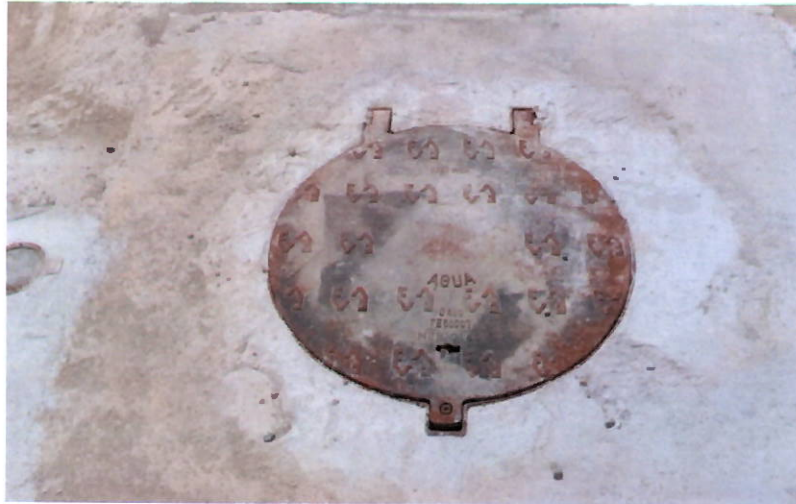
Tampa da caixa do macromedidor

e) caixa do macromedidor sem acesso devido a falta de ferramenta apropriada para sua abertura no local.