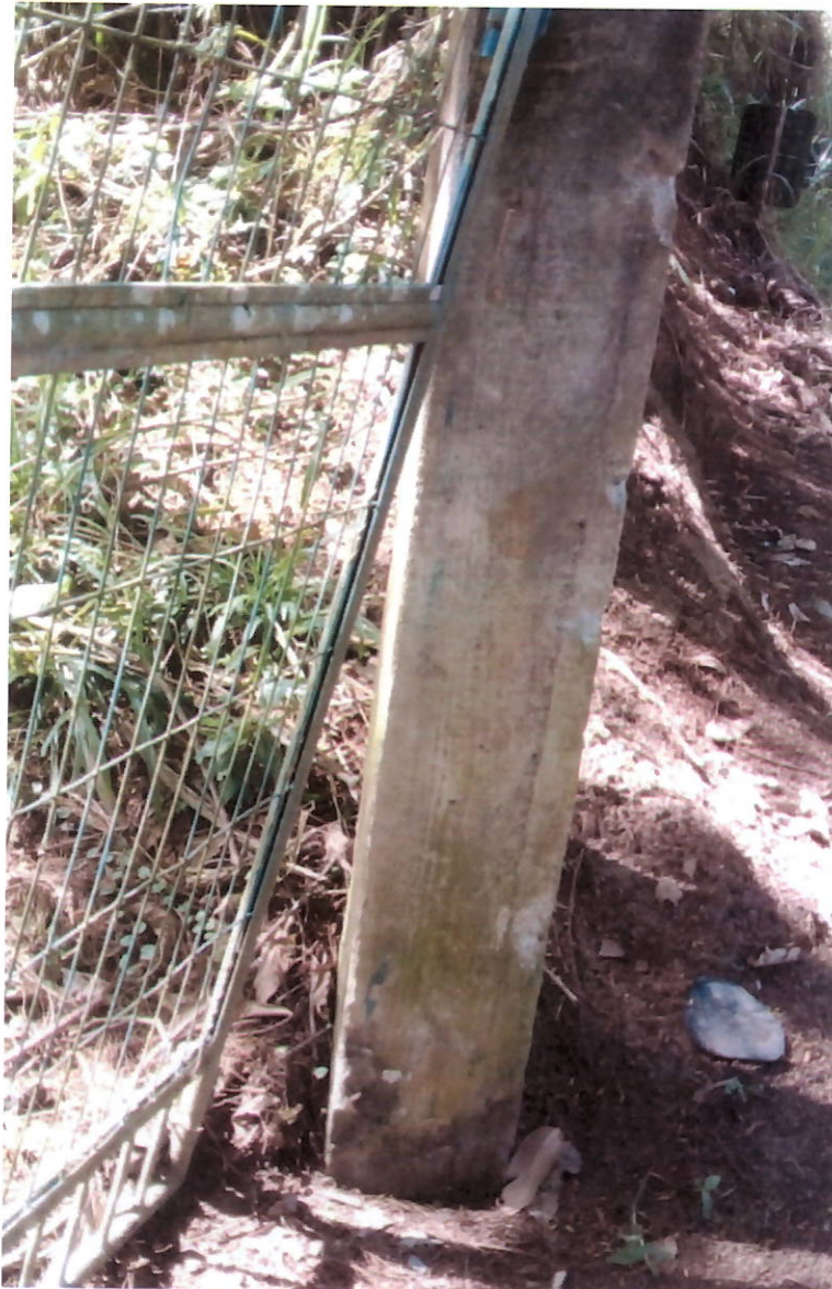
g) Abrigo do medidor de energia com telhar quebradas.

Governo do Estado do Rio de Janeiro Secretaria de Estado de Desenvolvimento Econômico, Energia e Relações Internacionais Agência Reguladora de Energia e Saneamento Básico do Estado do Rio de Janeiro