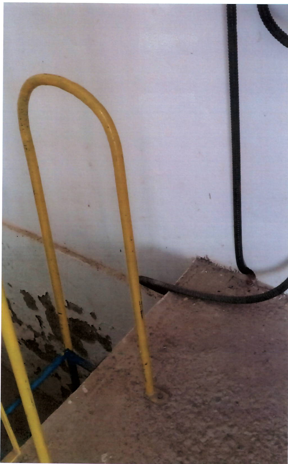
d) pintura desgastada no exterior do abrigo da EEAT.