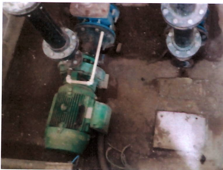
Eletrobomba reserva não montada

Governo do Estado do Rio de Janeiro Secretaria de Estado de Desenvolvimento Econômico, Energia e Relações Internacionais Agência Reguladora de Energia e Saneamento Básico do Estado do Rio de Janeiro