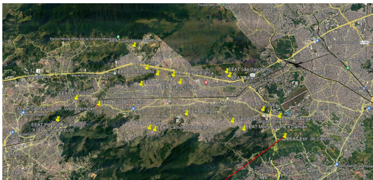
EEAT Estrada do Catonho