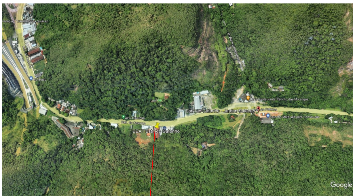
EEAT do Catonho