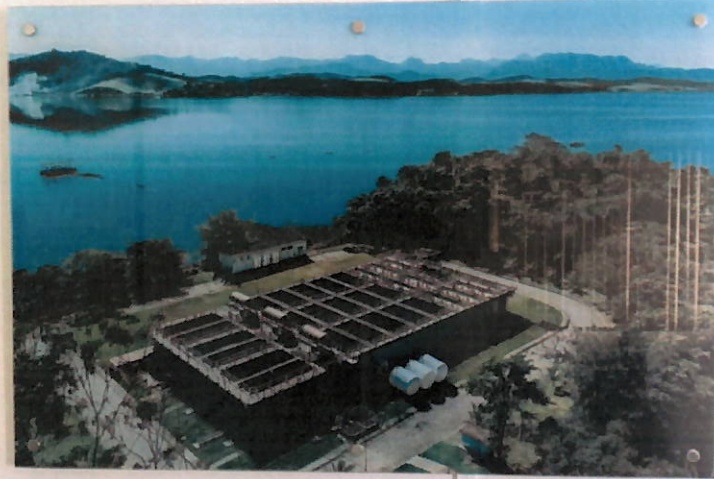
FOTO 1 - ETA JUTURNAÍBA