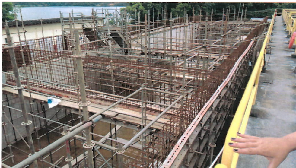
FOTO 4 - Flocculadores e decantadores

Governo do Estado do Rio de Janeiro Secretaria de Estado de Desenvolvimento Econômico, Energia e Relações Internacionais Agência Reguladora de Energia e Saneamento Básico do Estado do Rio de Janeiro