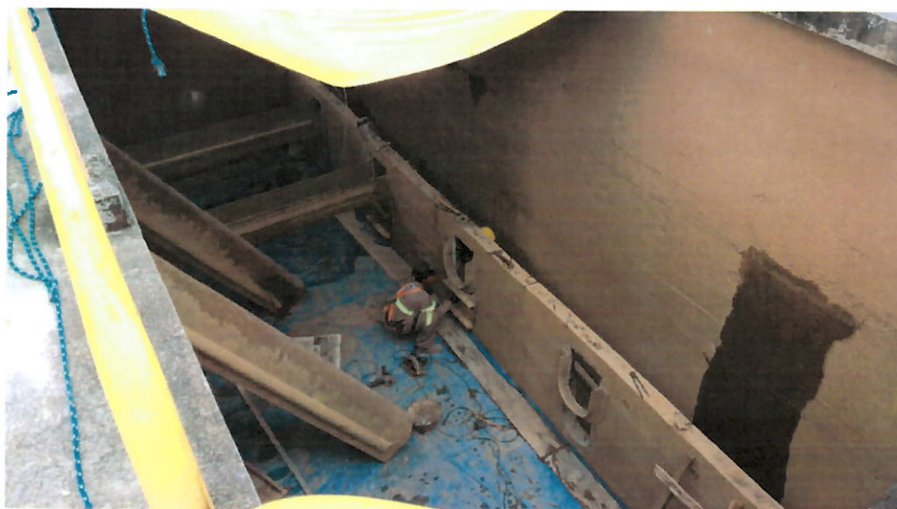
FOTO 3 - Processo de elevação das calhas dos filtros existentes

Previsão para que o novo soprador entrasse em funcionamento era 23DEZ2022,