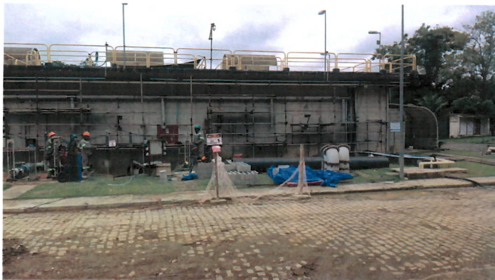
FOTO 2 - Retrofit sistema de lavagem filtros existentes

Previsão para que o novo soprador entrasse em funcionamento era 23DEZ2022,