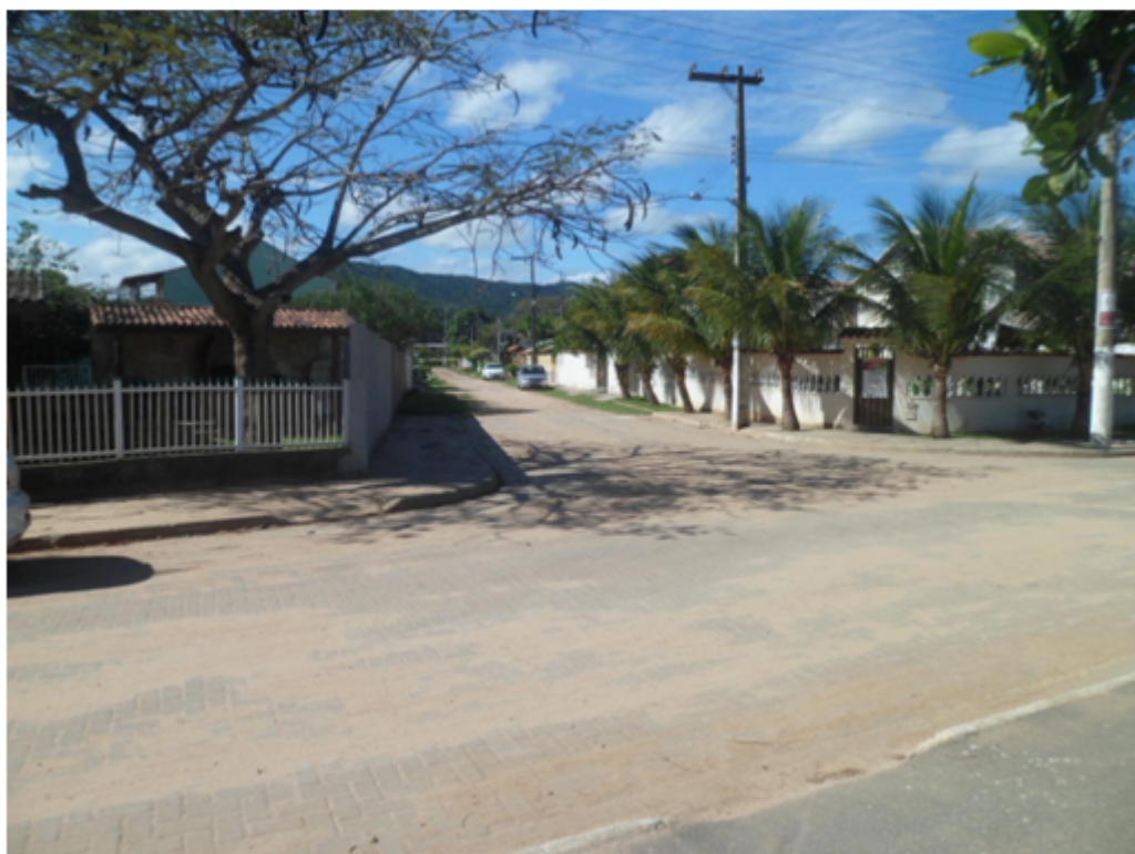
Foto 02 – Rua Dr. Tocantins com Av. Copacabana - Praia Linda – São Pedro da Aldeia