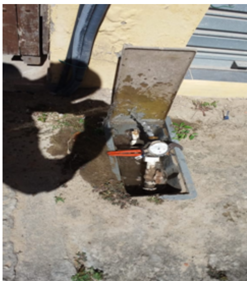
Foto 05 – Abertura da Tubulação no Hidrômetro, para Verificação da Saída D'Água