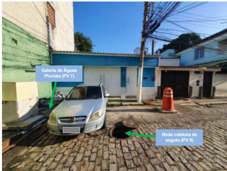
Foto 11 - Identificação dos PV's da rede coletora de esgoto e da galeira de águas pluviais

Governo do Estado do Rio de Janeiro Secretaria de Estado de Desenvolvimento Econômico, Energia e Relações Internacionais Agência Reguladora de Energia e Saneamento Básico do Estado do Rio de Janeiro