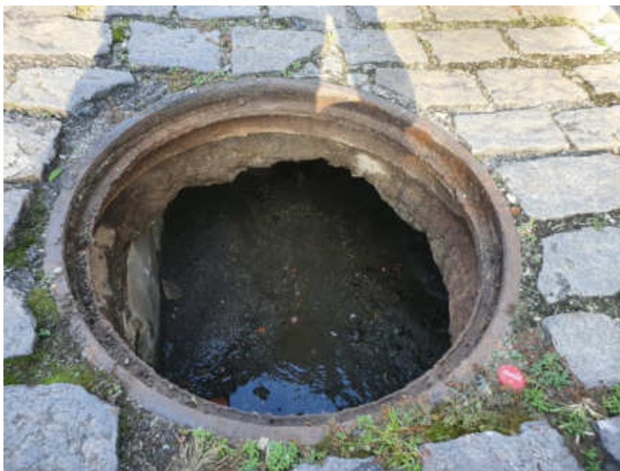
Foto 6 - Visão superior do poço de visita (PV 4) da galeria de águas pluviais