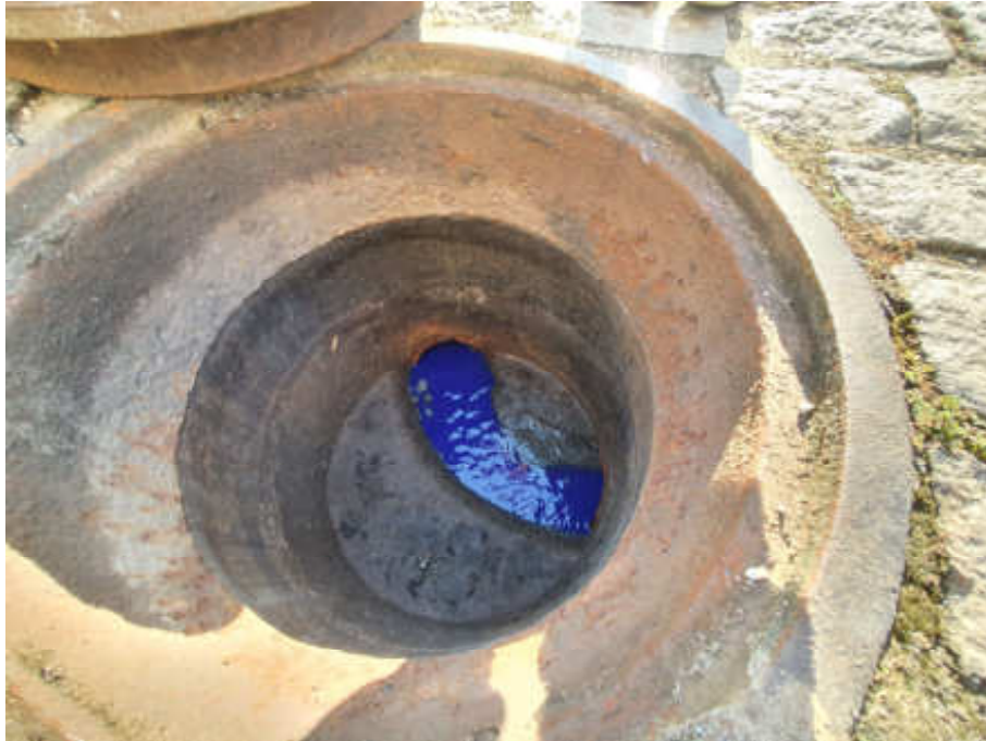
Foto 13 - Visão superior do poço de visita (PV 8) da rede coletora de esgoto

Governo do Estado do Rio de Janeiro Secretaria de Estado de Desenvolvimento Econômico, Energia e Relações Internacionais Agência Reguladora de Energia e Saneamento Básico do Estado do Rio de Janeiro