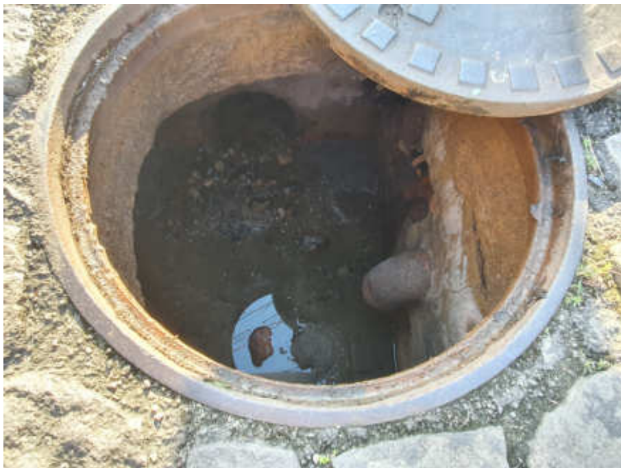
Foto 10 - Visão superior do poço de visita (PV 6) da galeria de águas pluviais