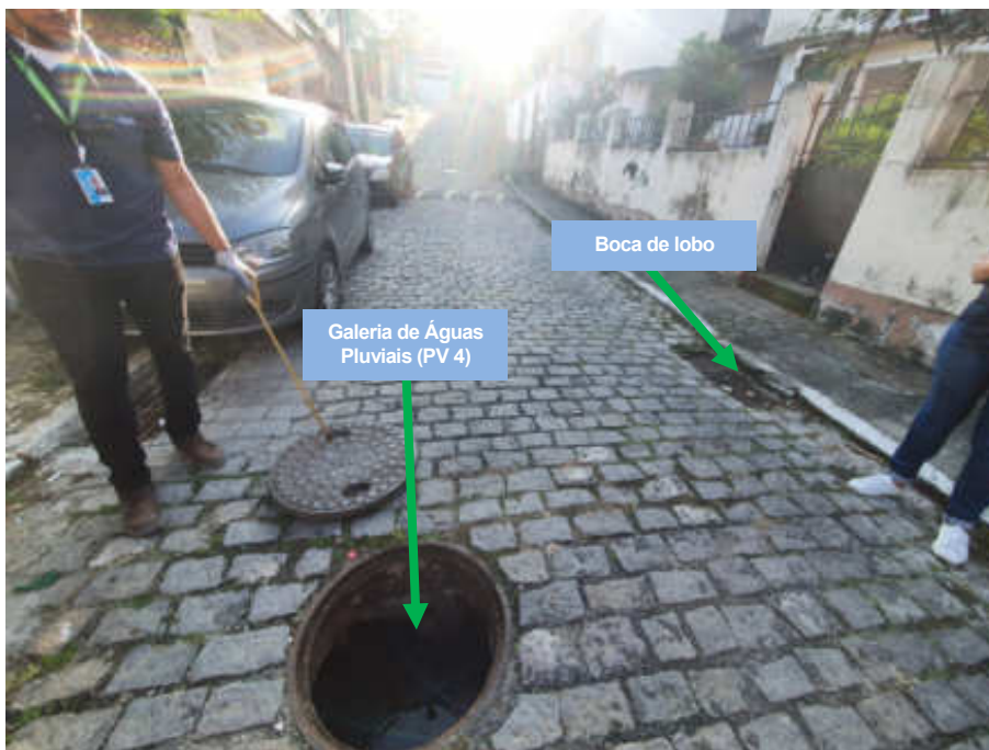
Foto 5 - Identificação do PV da galeria de águas pluviais e boca de lobo

Governo do Estado do Rio de Janeiro Secretaria de Estado de Desenvolvimento Econômico, Energia e Relações Internacionais Agência Reguladora de Energia e Saneamento Básico do Estado do Rio de Janeiro