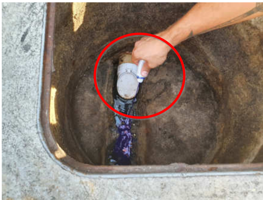
Foto 8 - Teste de corante na caixa de inspeção do morador