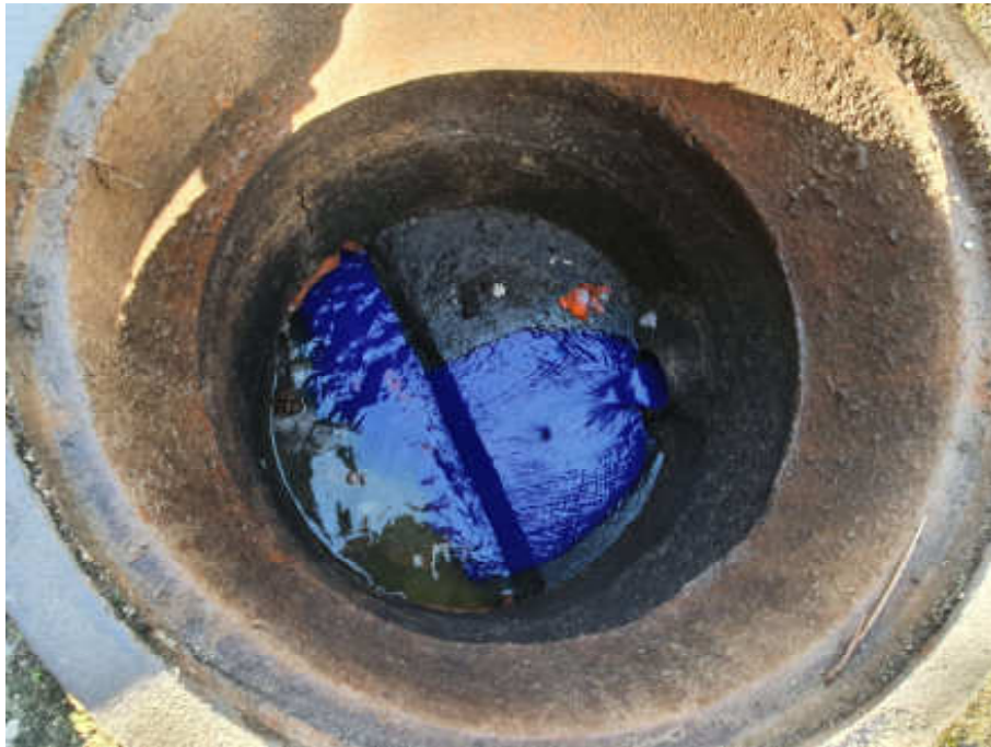
Foto 9 - Visão superior do poço de visita (PV 5) da rede coletora de esgoto em condições operacionais

Governo do Estado do Rio de Janeiro Secretaria de Estado de Desenvolvimento Econômico, Energia e Relações Internacionais Agência Reguladora de Energia e Saneamento Básico do Estado do Rio de Janeiro