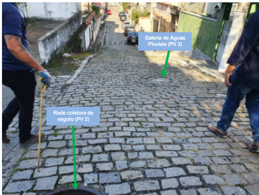
Foto 2 - Identificação dos PV's da rede coletora de esgoto e da galeria de águas pluviais