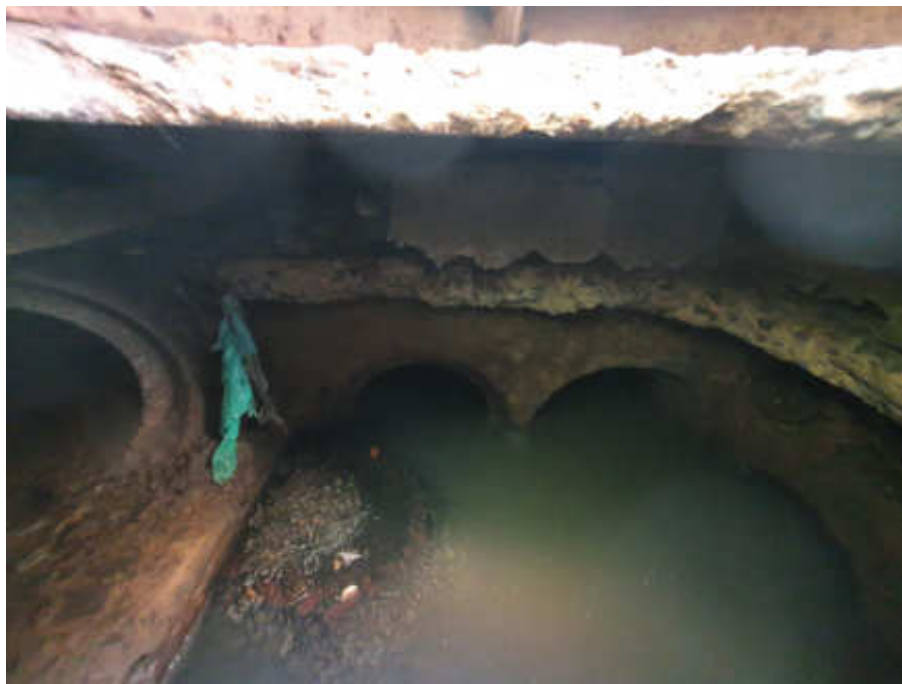
Foto 12 - Visão superior do poço de visita (PV 7) da galeria de águas pluviais