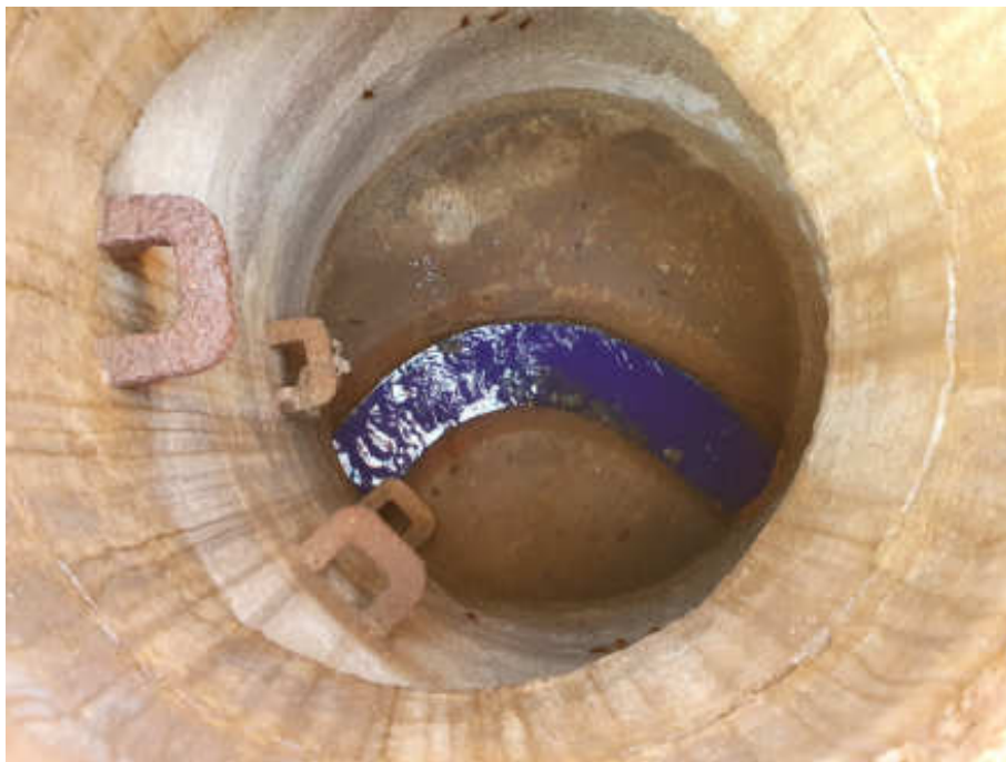
Foto 14 - Visão superior do poço de visita (PV 1) da rede coletora de esgoto