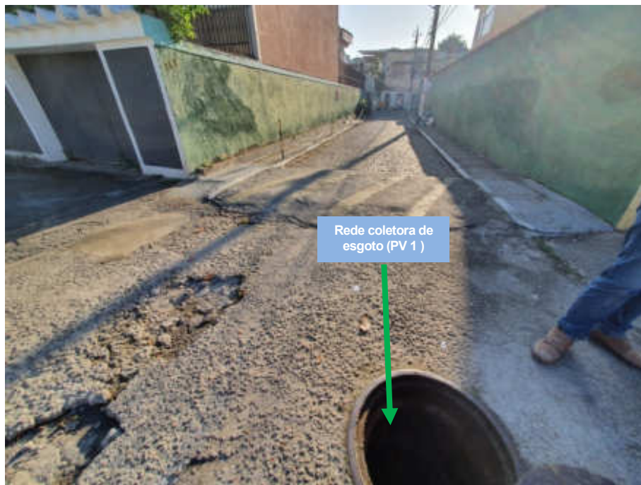
Foto 1 - Entrada do Condomínio com tampa de acesso ao PV da rede coletora de esgoto