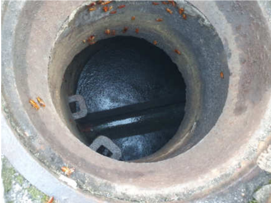
Foto 3 - Visão superior do poço de visita (PV 2) da rede coletora de esgoto

Governo do Estado do Rio de Janeiro Secretaria de Estado de Desenvolvimento Econômico, Energia e Relações Internacionais Agência Reguladora de Energia e Saneamento Básico do Estado do Rio de Janeiro