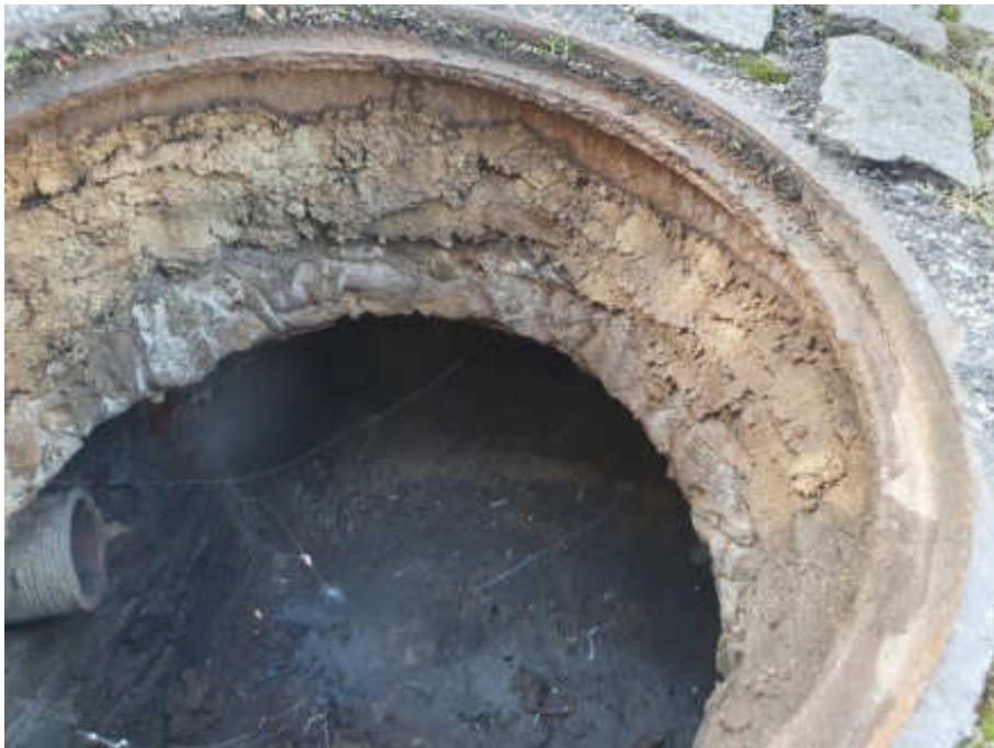
Foto 4 - Visão superior do poço de visita (PV 3) da galeria de águas pluviais