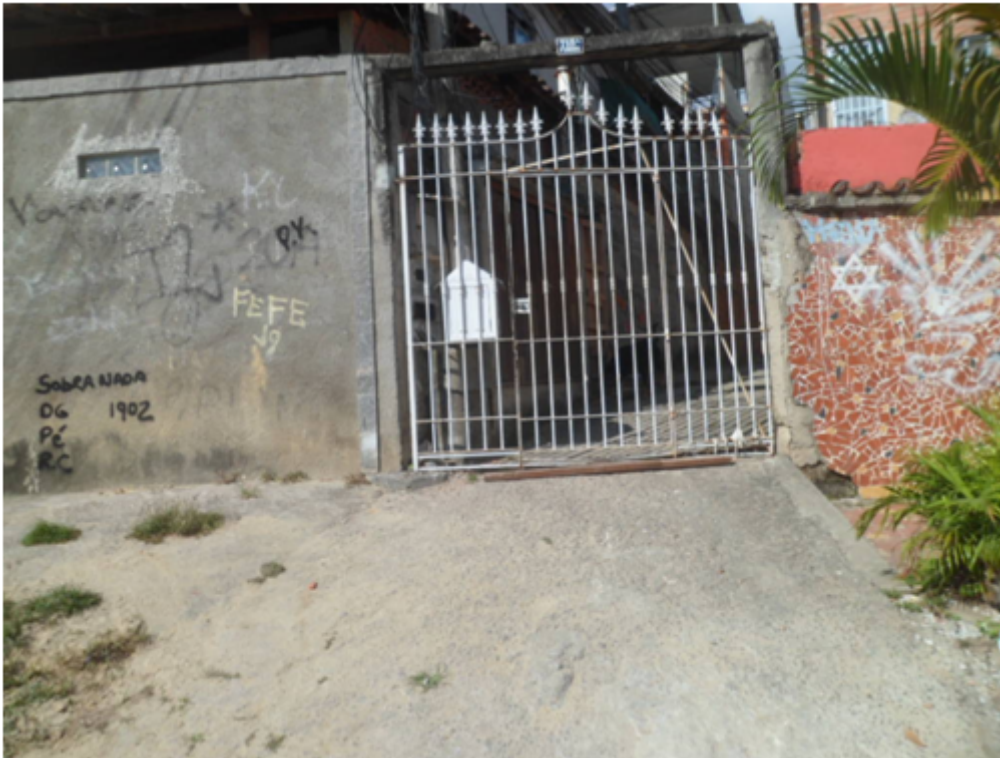
Foto 11 – Entrada da Vila onde encontra-se as bombas d'água que abastecem a comunidade