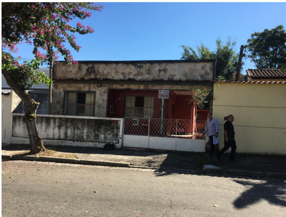
RESIDÊNCIA À RUA ANTÔNIO CHAGAS, 346, BAIRRO CALIFÓRNIA, CAMPO GRANDE