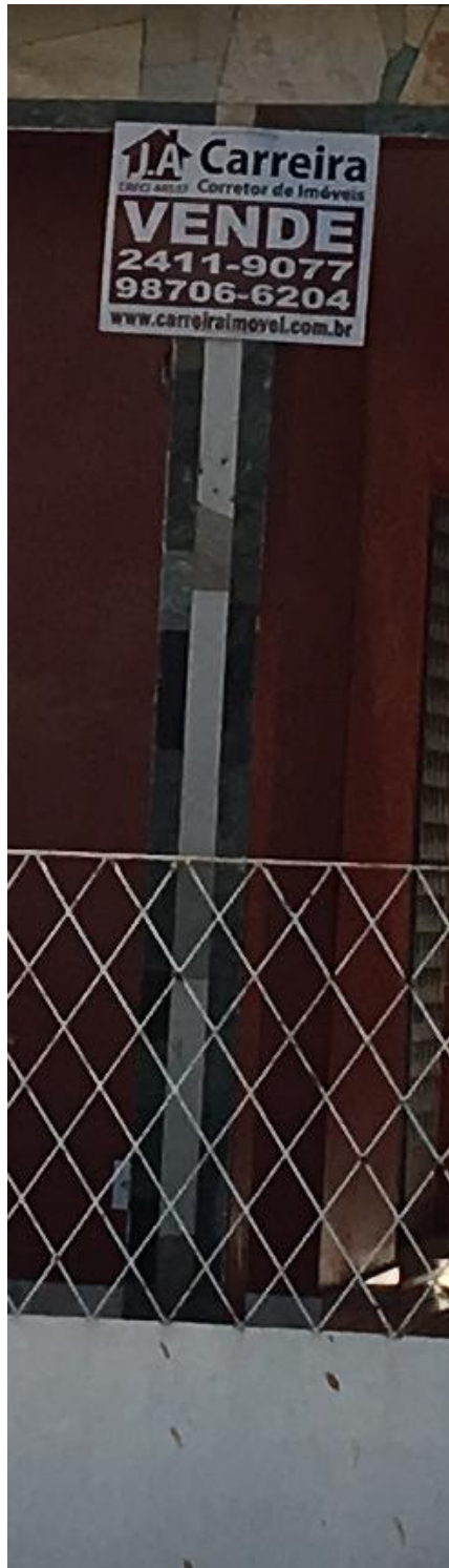
PLACA INDICATIVA PARA A VENDA DO IMÓVEL