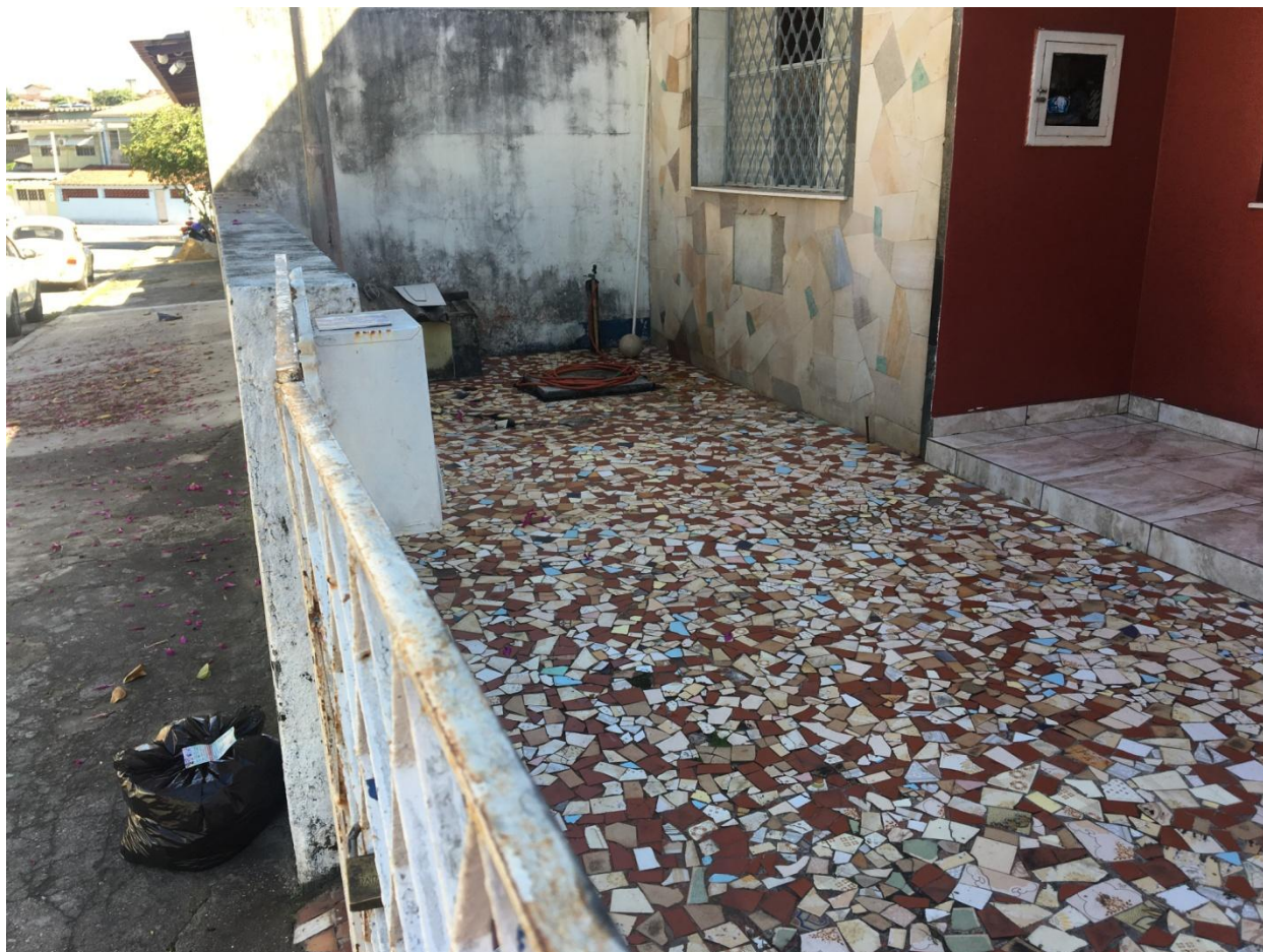
ÁREA DISPONÍVEL PARA CONSTRUÇÃO DE UMA CISTERNA

Na oportunidade da visita, a pressão disponível era de 4 m.c.a., senão vejamos: