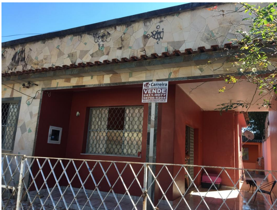
RESIDÊNCIA À RUA ANTÔNIO CHAGAS, 346, BAIRRO CALIFÓRNIA, CAMPO GRANDE