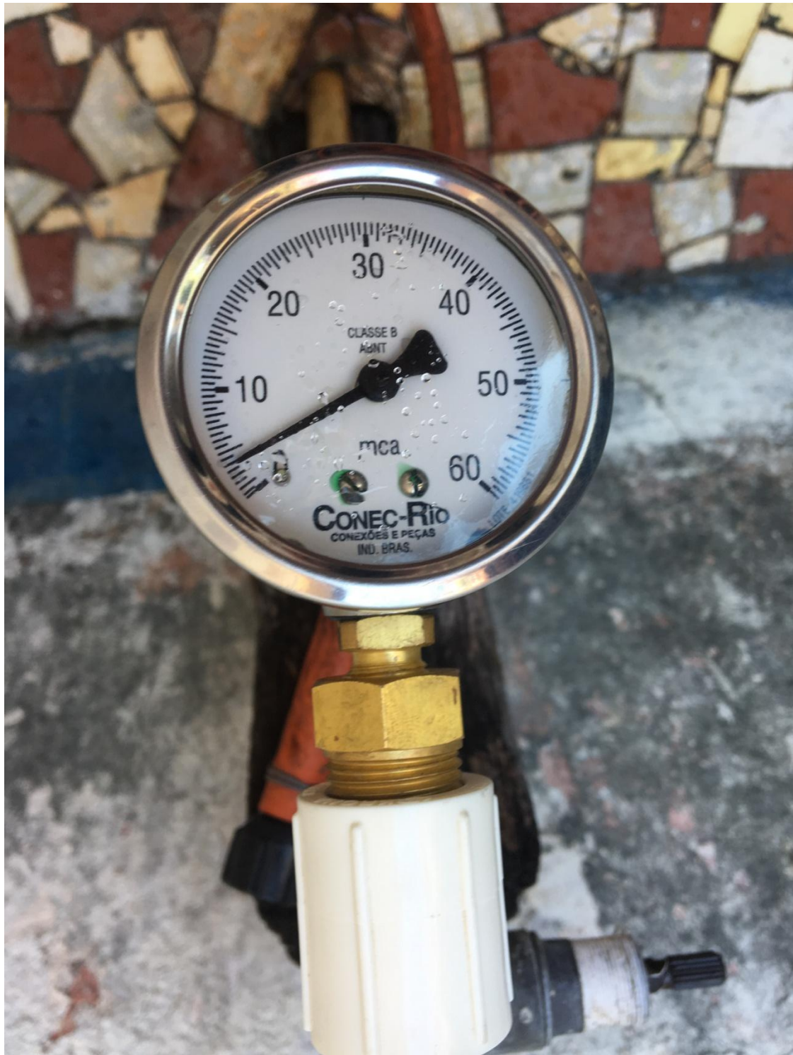
PRESSÃO MEDIDA NA RESIDÊNCIA - 4 M.C.A.

Secretaria de Desenvolvimento Econômico, Emprego e Relações Internacionais Agência Reguladora de Energia e Saneamento Básico do Estado do Rio de Janeiro