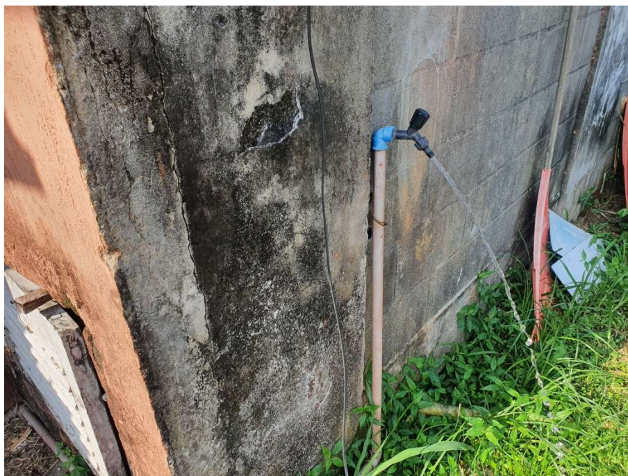
Foto 2 - Torneira na entrada do Condomínio