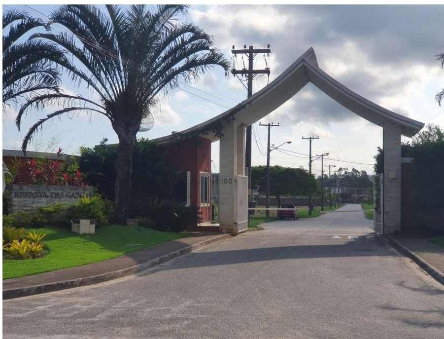
Foto 1 - Entrada do Condomínio Reserva das Garças.