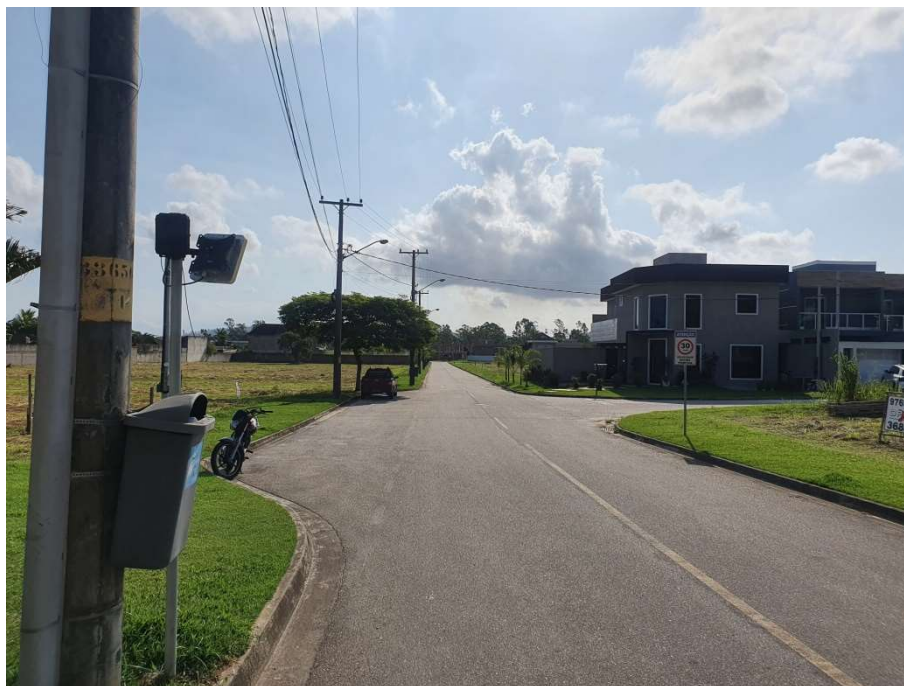
Foto 3 - Parte interna do Condomínio

Governo do Estado do Rio de Janeiro Secretaria de Estado de Desenvolvimento Econômico, Energia e Relações Internacionais Agência Reguladora de Energia e Saneamento Básico do Estado do Rio de Janeiro