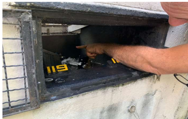
Hidrômetro da residência nº 120