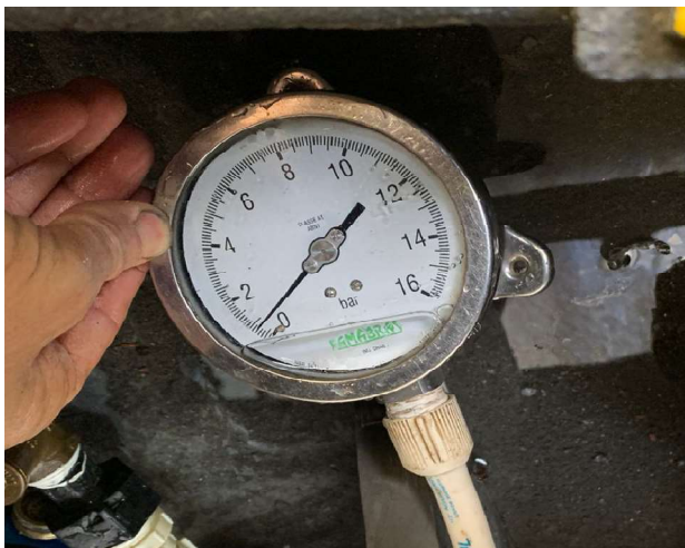
Manômetro instalado no HD da residência mostrando pressão de 7 m.c.a. após o fechamento do registro do reservatório demonstrando a manobra

Governo do Estado do Rio de Janeiro Secretaria de Estado de Desenvolvimento Econômico, Emprego e Relações Internacionais Agência Reguladora de Energia e Saneamento Básico do Estado do Rio de Janeiro