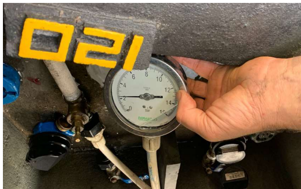
Manômetro instalado na residência nº 120 mostrando pressão de 24 m.c.a.