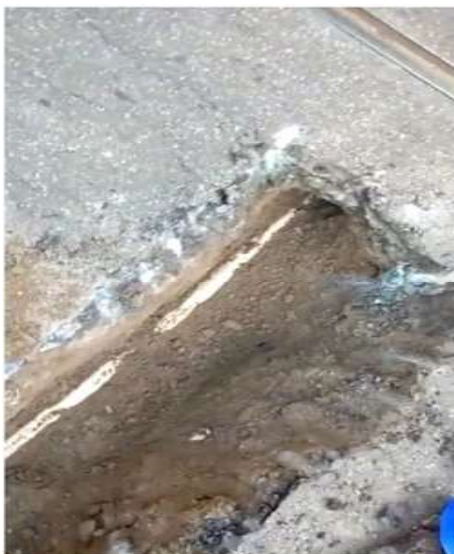
Imagem enviada pelo Engº Matheus Chagas à respeito da execução da desobstrução do ramal. A execução estava seguindo o distribuidor quando parou por causa do trilho