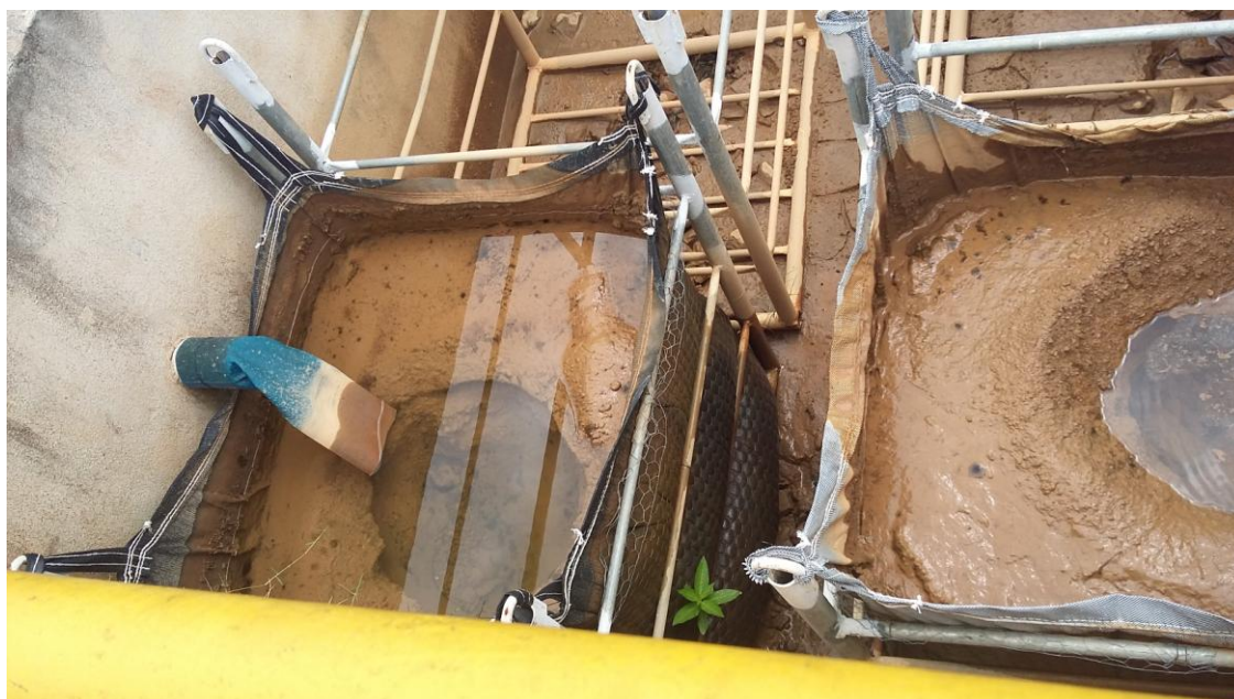
DETALHE DOS "BAG'S" PARA DESÁGUE DE LODO DOS DECANTADORES