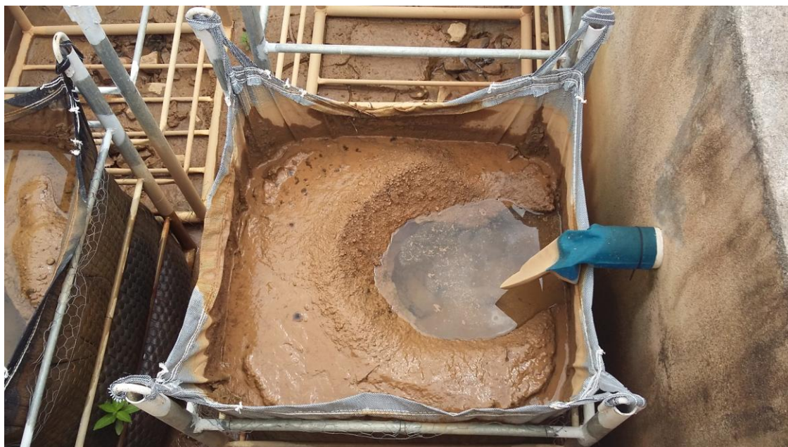
DETALHE DO "BAG" PARA DESÁGUE DE LODO DOS DECANTADORES

Governo do Estado do Rio de Janeiro Secretaria de Estado da Casa Civil e Desenvolvimento Econômico Agência Reguladora de Energia e Saneamento Básico do Estado do Rio de Janeiro