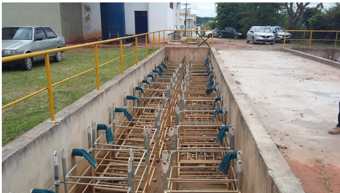
LEITO DE "BAG'S" PARA DESÁGUE DE LODO DOS DECANTADORES

Governo do Estado do Rio de Janeiro Secretaria de Estado da Casa Civil e Desenvolvimento Econômico Agência Reguladora de Energia e Saneamento Básico do Estado do Rio de Janeiro