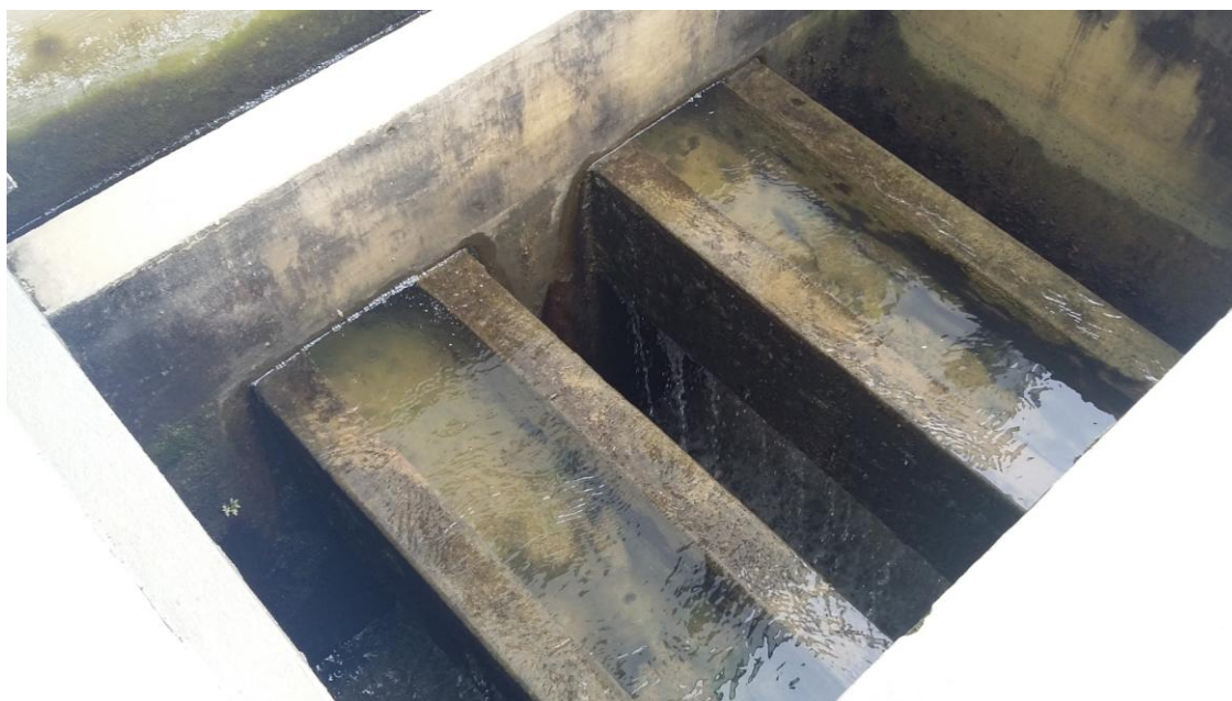
FILTRO ANTIGO REFORMADO