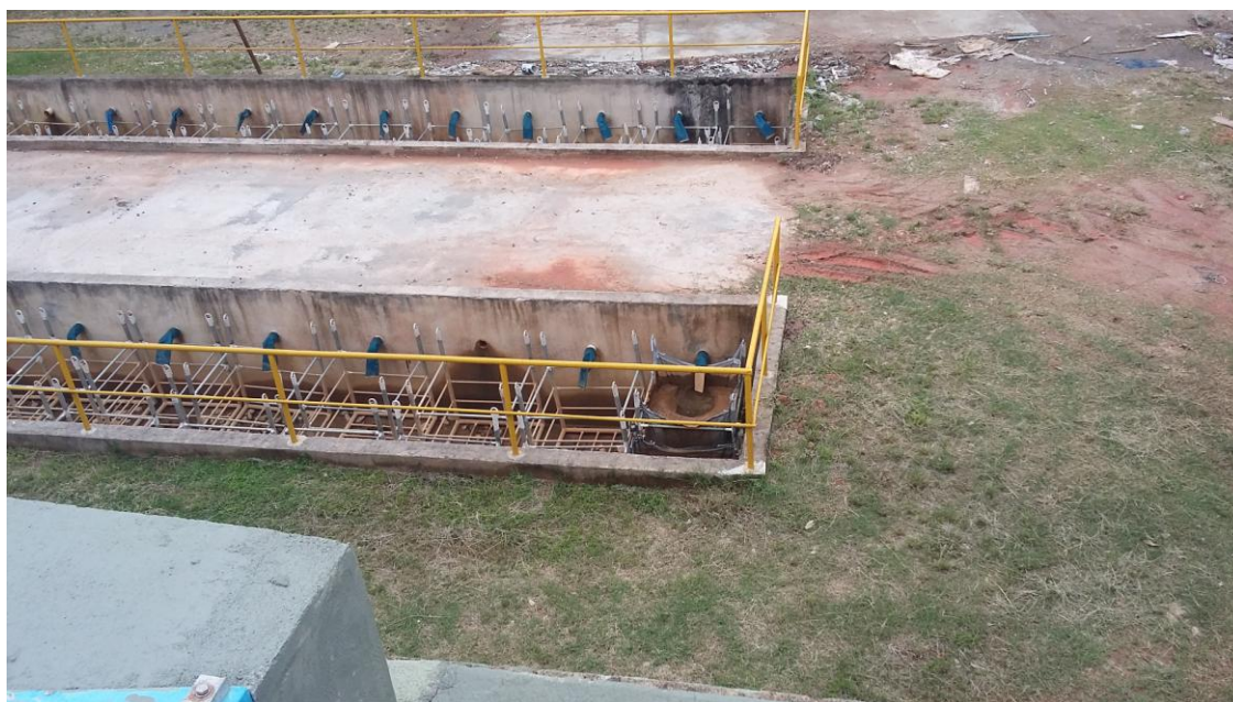
LEITOS DE "BAG'S" PARA DESÁGUE DE LODO DOS DECANTADORES