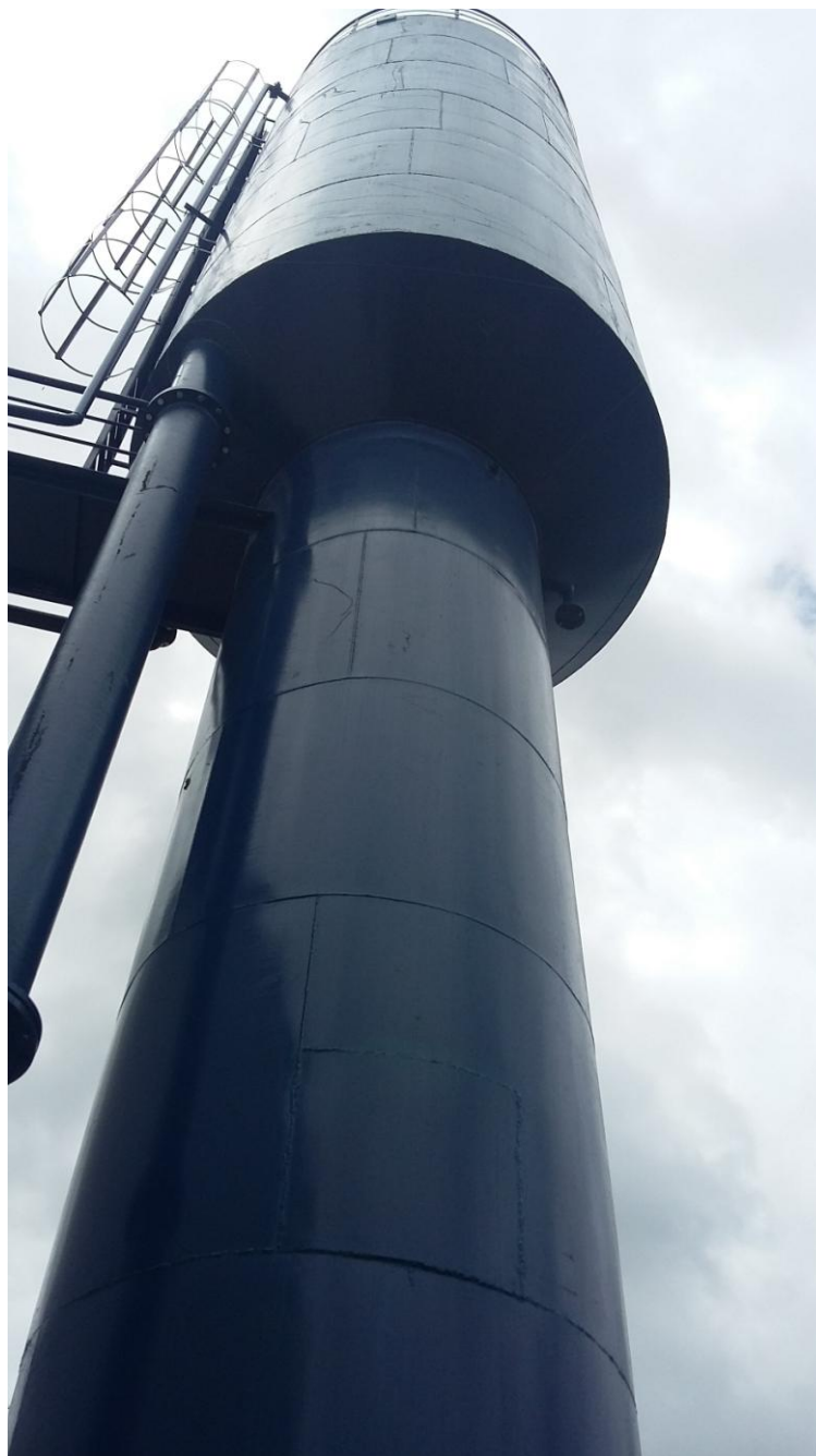
RESERVATÓRIO DE ÁGUA DE LAVAGEM DOS FILTROS

Governo do Estado do Rio de Janeiro Secretaria de Estado da Casa Civil e Desenvolvimento Econômico Agência Reguladora de Energia e Saneamento Básico do Estado do Rio de Janeiro