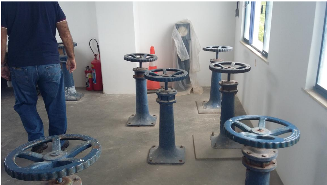
GALERIA DE COMANDO DOS FILTROS

Governo do Estado do Rio de Janeiro Secretaria de Estado da Casa Civil e Desenvolvimento Econômico Agência Reguladora de Energia e Saneamento Básico do Estado do Rio de Janeiro