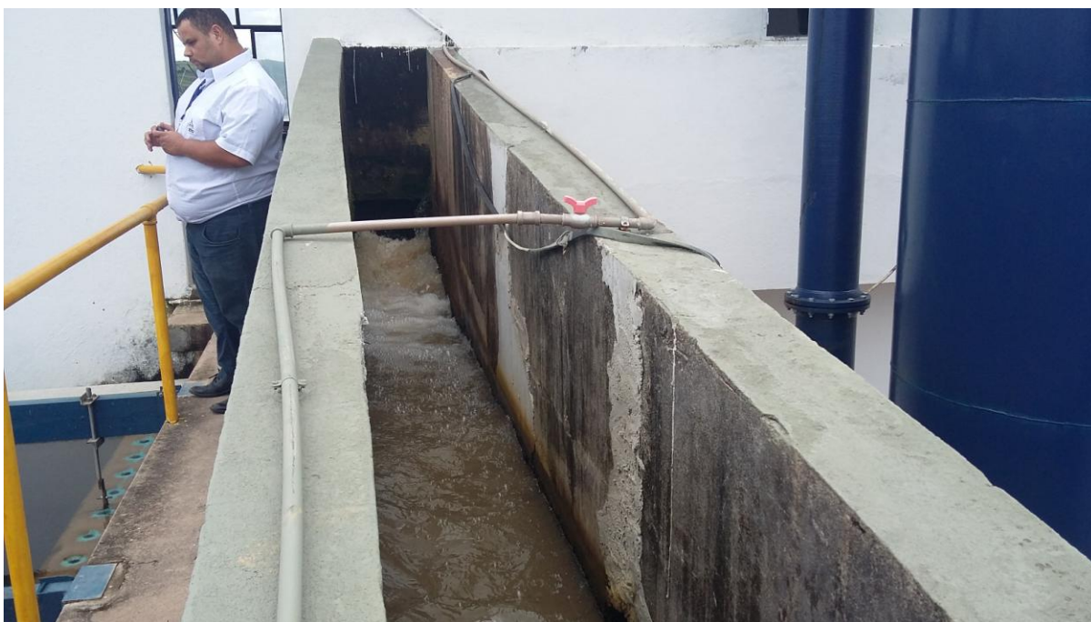
ENTRADA DA ETA

Durante a vistoria constatamos que as obras estavam concluídas e a Estação de Tratamento de Água trabalhando a plena carga. Não foram identificados problemas de abastecimento de água no Município de Pinheiral.