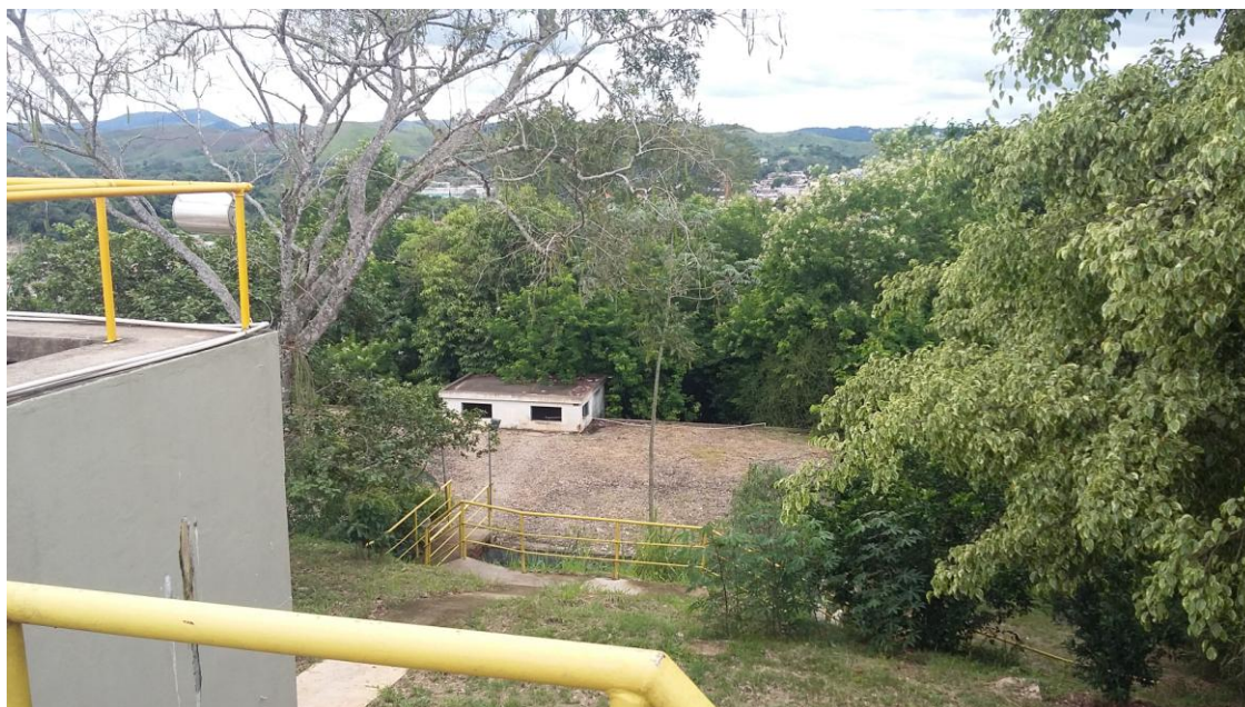
RESERVATÓRIO DE ÁGUA TRATADA - AO FUNDO

Governo do Estado do Rio de Janeiro Secretaria de Estado da Casa Civil e Desenvolvimento Econômico Agência Reguladora de Energia e Saneamento Básico do Estado do Rio de Janeiro