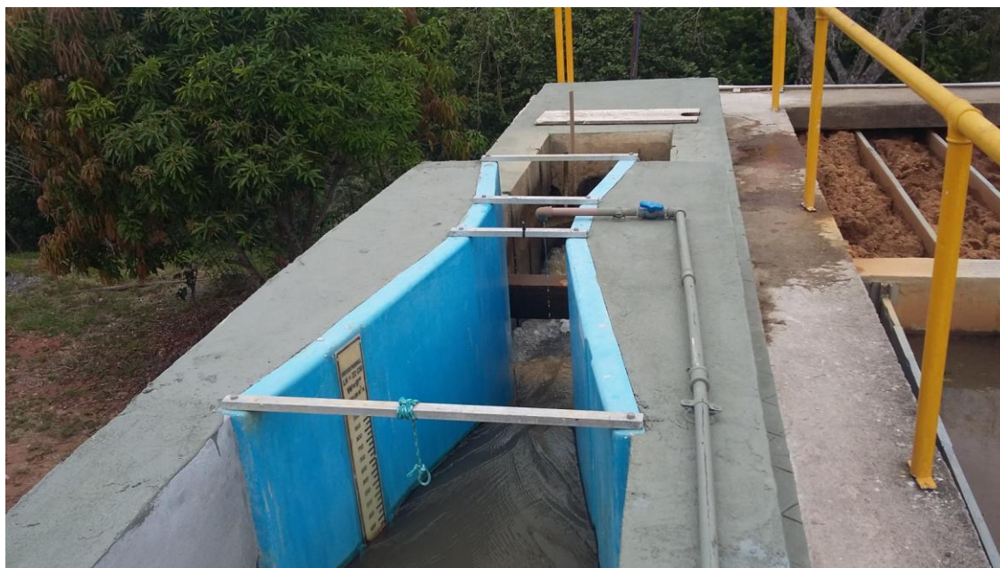
CALHA PARSHALL - MEDIÇÃO DE VAZÃO E PONTO DE APLICAÇÃO DE PRODUTOS QUÍMICOS

Governo do Estado do Rio de Janeiro Secretaria de Estado da Casa Civil e Desenvolvimento Econômico Agência Reguladora de Energia e Saneamento Básico do Estado do Rio de Janeiro