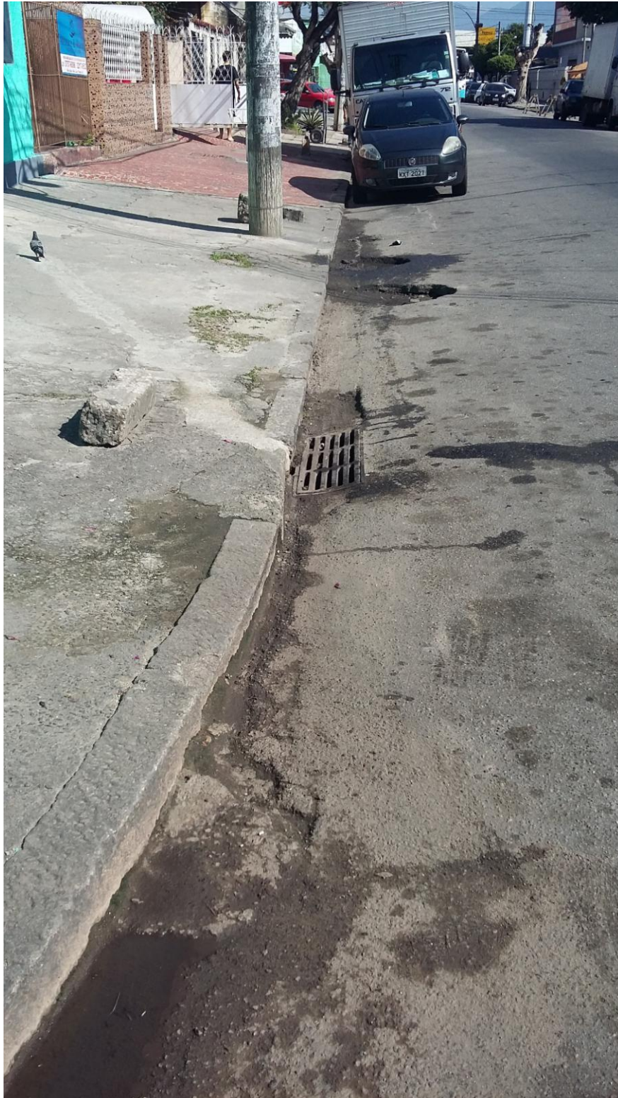
RUA CATÃO - BOCA DE LOBO

Serviço Público Estadual Processo nº E-12/003.272/2016 Data: 22/06/2016 fls. Rubrica: ID 2146335-2