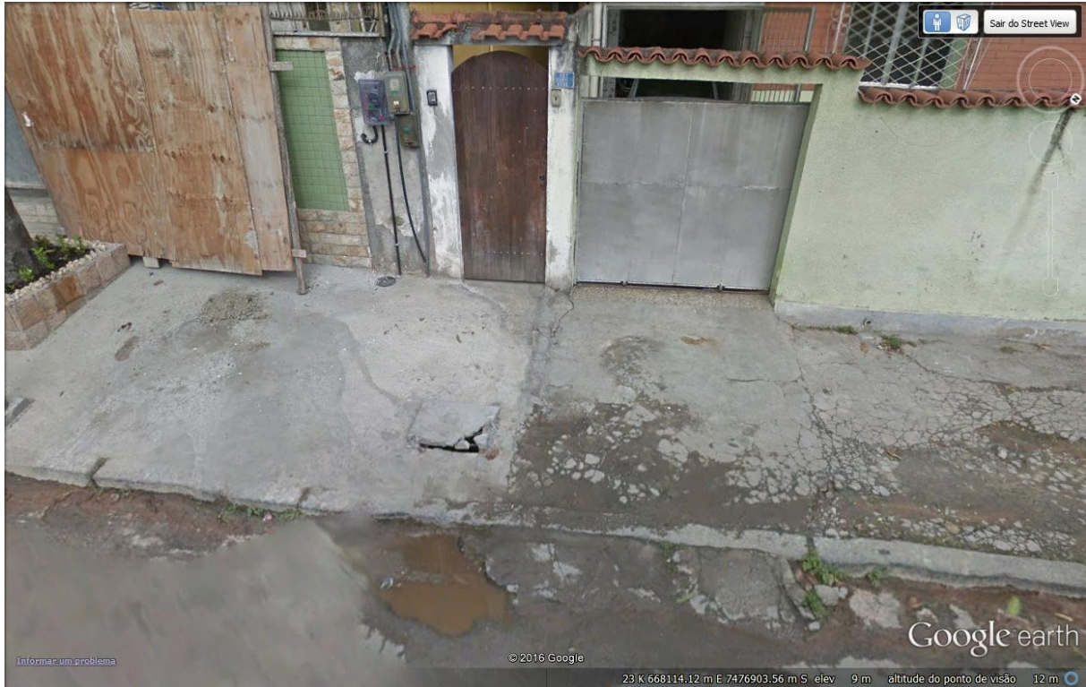
DETALHE DA CAIXA DE INSPEÇÃO - IMAGEM DO GOOGLE EARTH DE 14-05-2016

Serviço Público Estadual Processo nº E-12/003.272/2016 Data: 22/06/2016 fls. Rubrica: ID 2146335-2