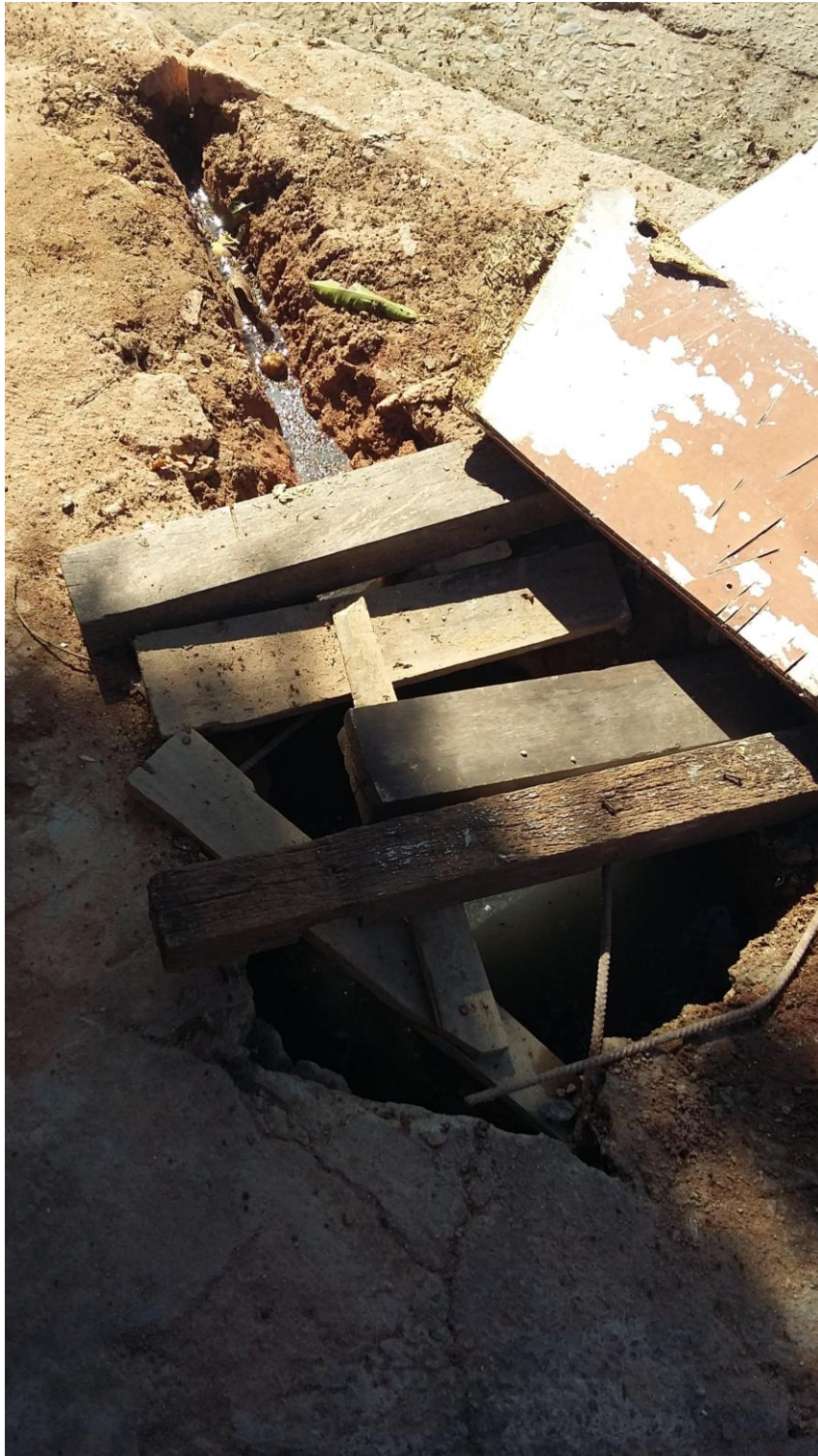
DETALHE DA CAIXA DE INSPEÇÃO DO USUÁRIO RECLAMANTE ESGOTO DIRECIONADO PARA A SARJETA

Serviço Público Estadual Processo nº E-12/003.272/2016 Data: 22/06/2016 fls. Rubrica: ID 2146335-2