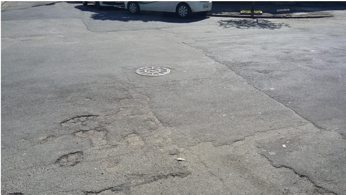
RUA NETUNO - BUEIRO DE INSPEÇÃO