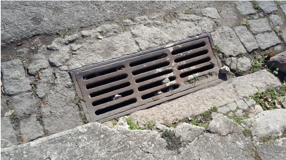
RUA NETUNO - BOCA DE LOBO

Serviço Público Estadual Processo nº E-12/003.272/2016 Data: 22/06/2016 fls. Rubrica: ID 2146335-2