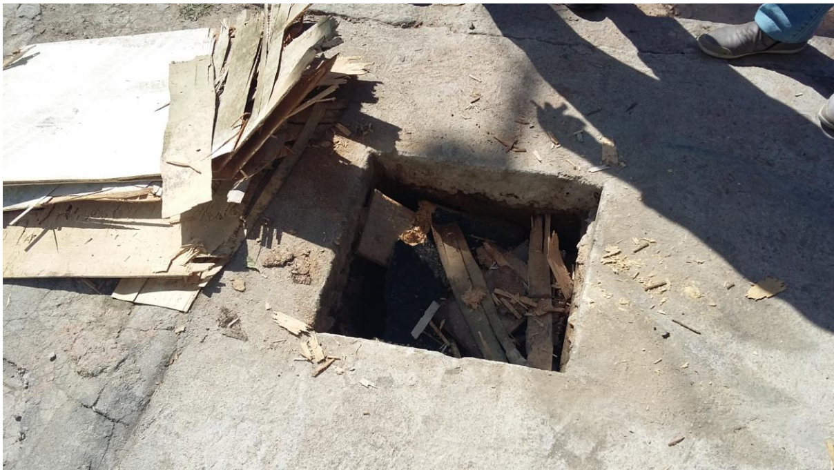
DETALHE DA CAIXA DE INSPEÇÃO TOTALMENTE OBSTRUÍDA - EM 29-06-2016