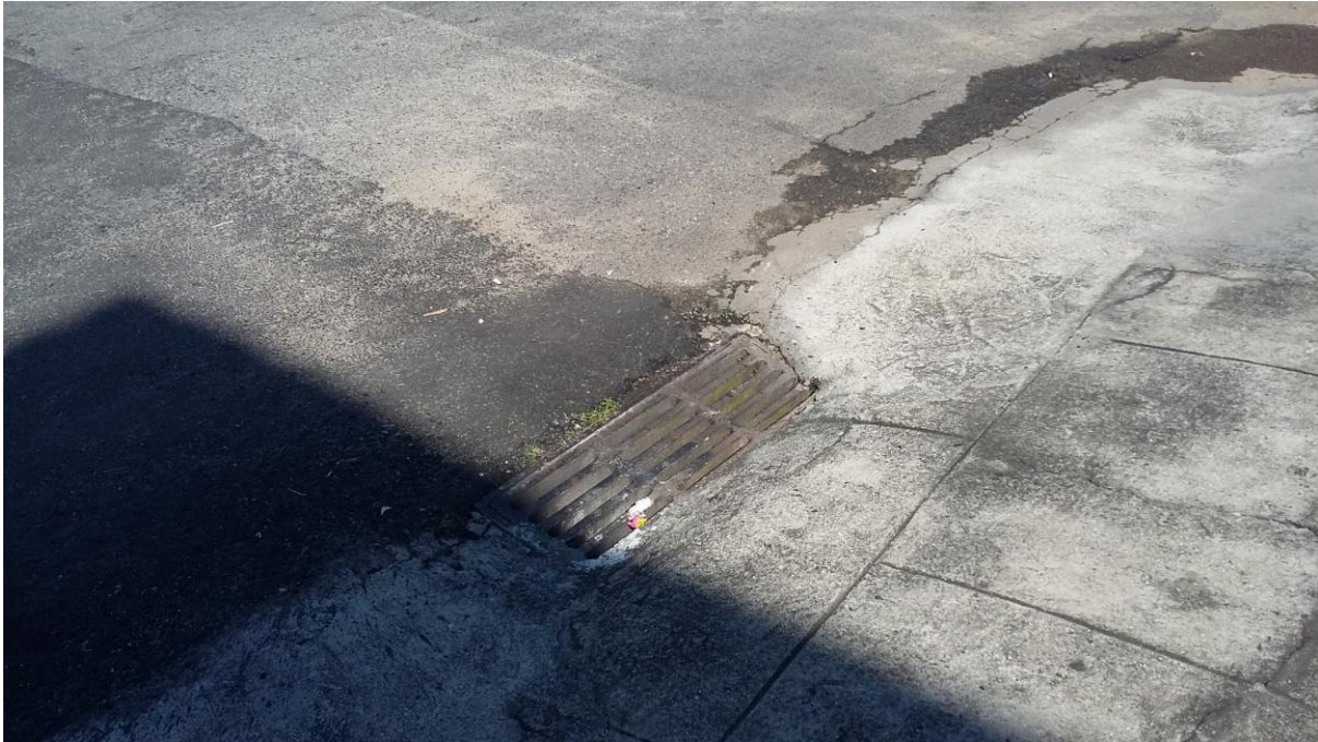
RUA NETUNO - BOCA DE LOBO

Serviço Público Estadual Processo nº E-12/003.272/2016 Data: 22/06/2016 fls. Rubrica: ID 2146335-2