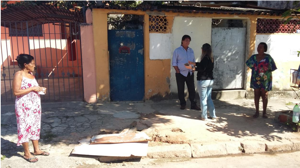
VISTA GERAL - FOTOGRAFIA TIRADA EM 29-06-2016

Serviço Público Estadual Processo nº E-12/003.272/2016 Data: 22/06/2016 fls. Rubrica: ID 2146335-2