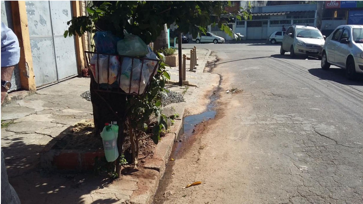
ESGOTO DIRECIONADO PELA SARJETA PARA A RUA CATÃO

Serviço Público Estadual Processo nº E-12/003.272/2016 Data: 22/06/2016 fls. Rubrica: ID 2146335-2