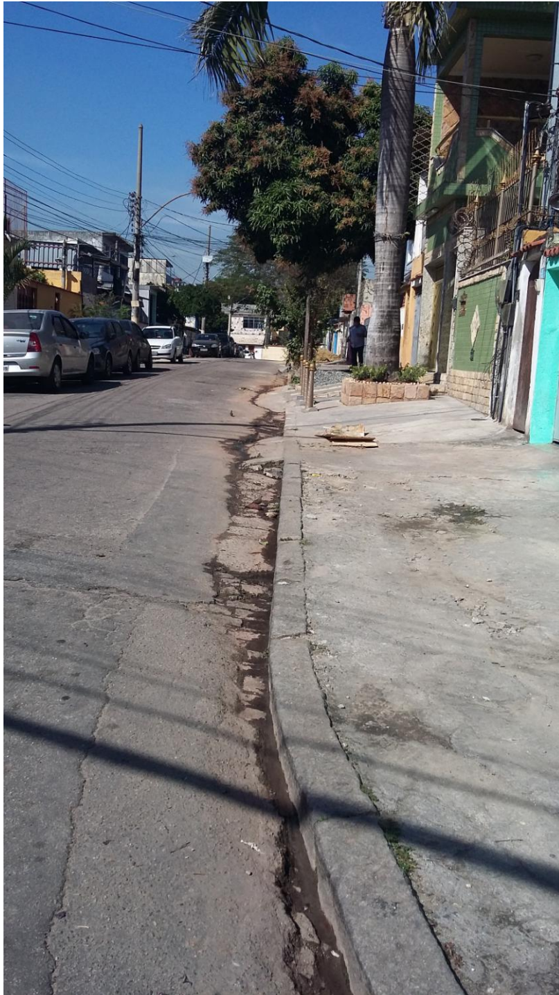
RUA ITACARÉ - ESQUINA DA RUA CATÃO

centro das ruas e bocas de lobo junto às calçadas. O material fotográfico permite visualizar a situação.