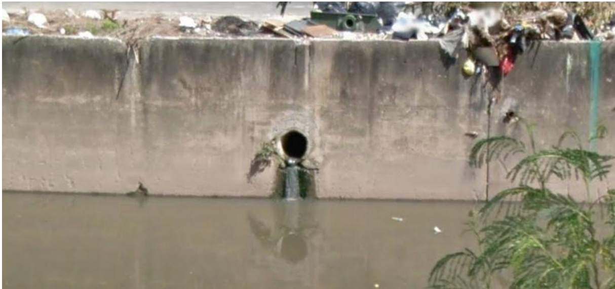
DETALHE DE UM DOS PONTOS DE LANÇAMENTO DA RUA SARGENTO BENEDITO DA SILVA