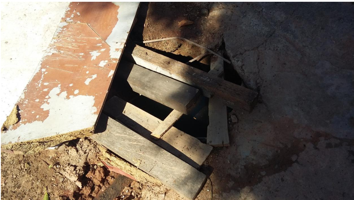
DETALHE DA CAIXA DE INSPEÇÃO DO USUÁRIO RECLAMANTE