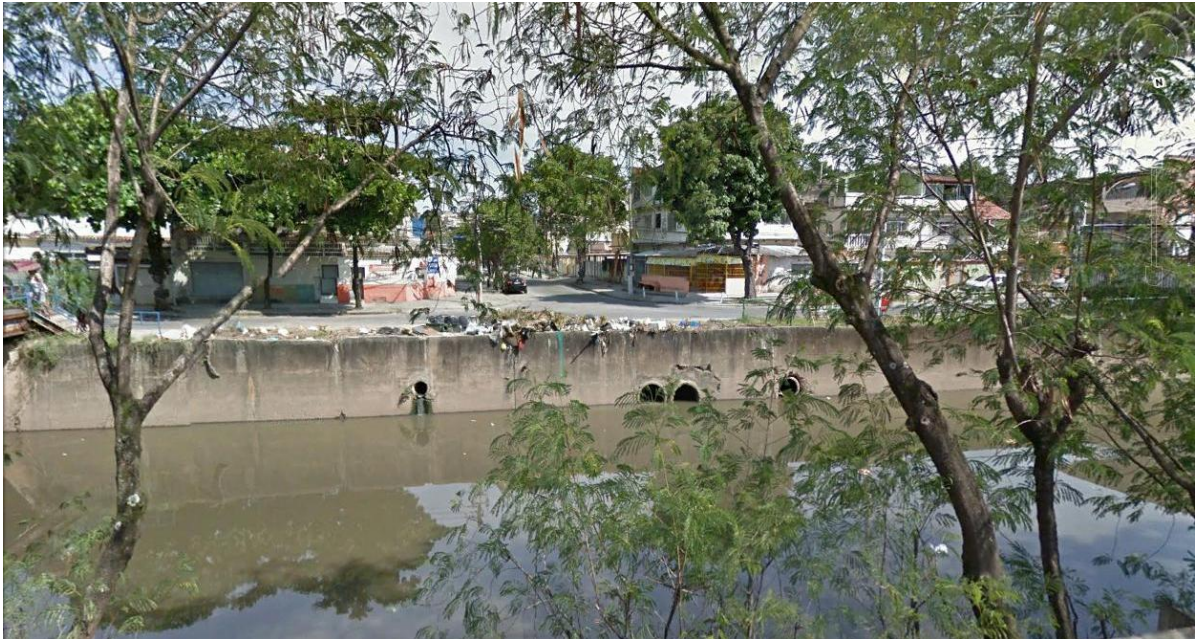
PONTOS DE LANÇAMENTO DA RUA SARGENTO BENEDITO DA SILVA

Serviço Público Estadual Processo nº E-12/003.272/2016 Data: 22/06/2016 fls. Rubrica: ID 2146335-2