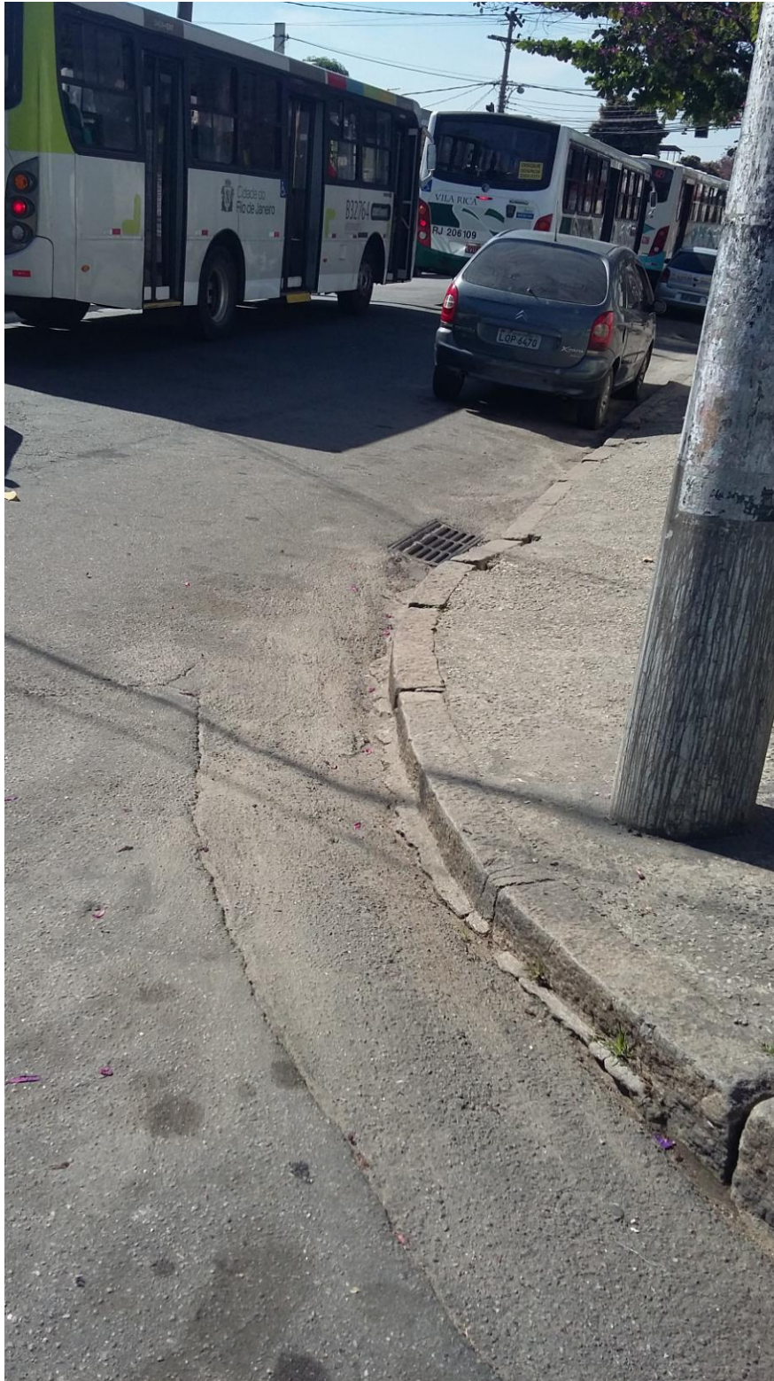
RUA CATÃO - BOCA DE LOBO

Serviço Público Estadual Processo nº E-12/003.272/2016 Data: 22/06/2016 fls. Rubrica: ID 2146335-2