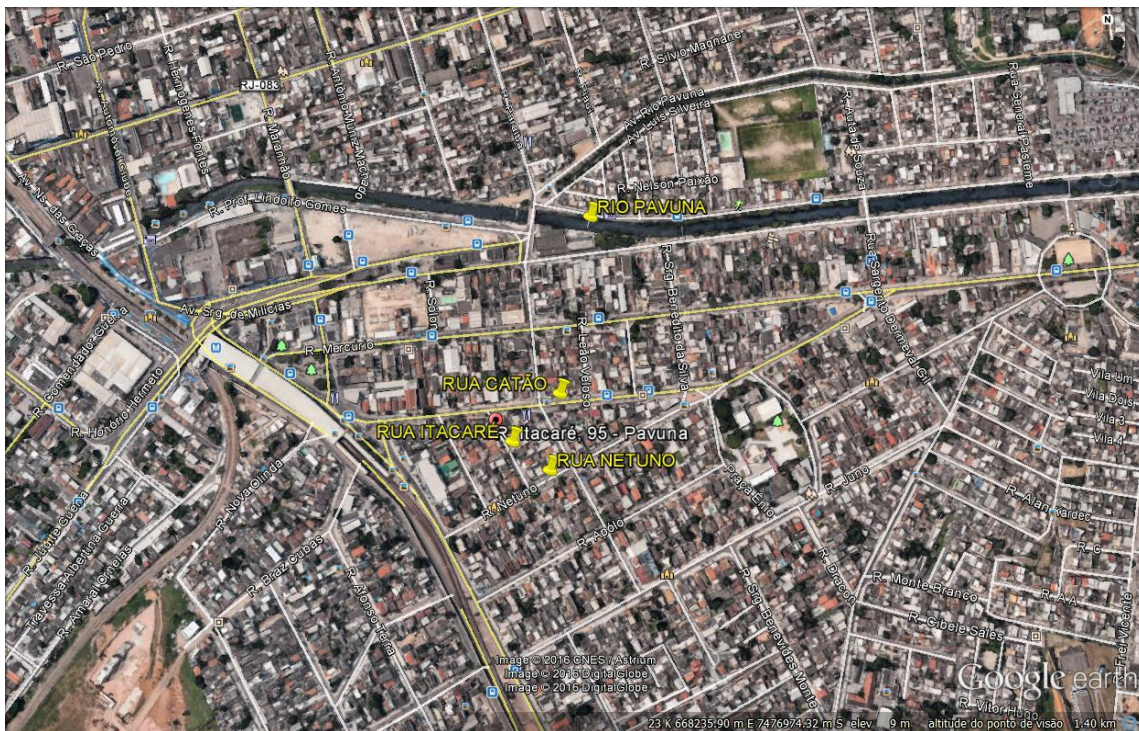
RUA ITACARÉ, CATÃO E NETUNO, E RIO PAVUNA

E toda a região do entorno do local drena, naturalmente, para o Rio Pavuna, conforme visualizado na próxima imagem.