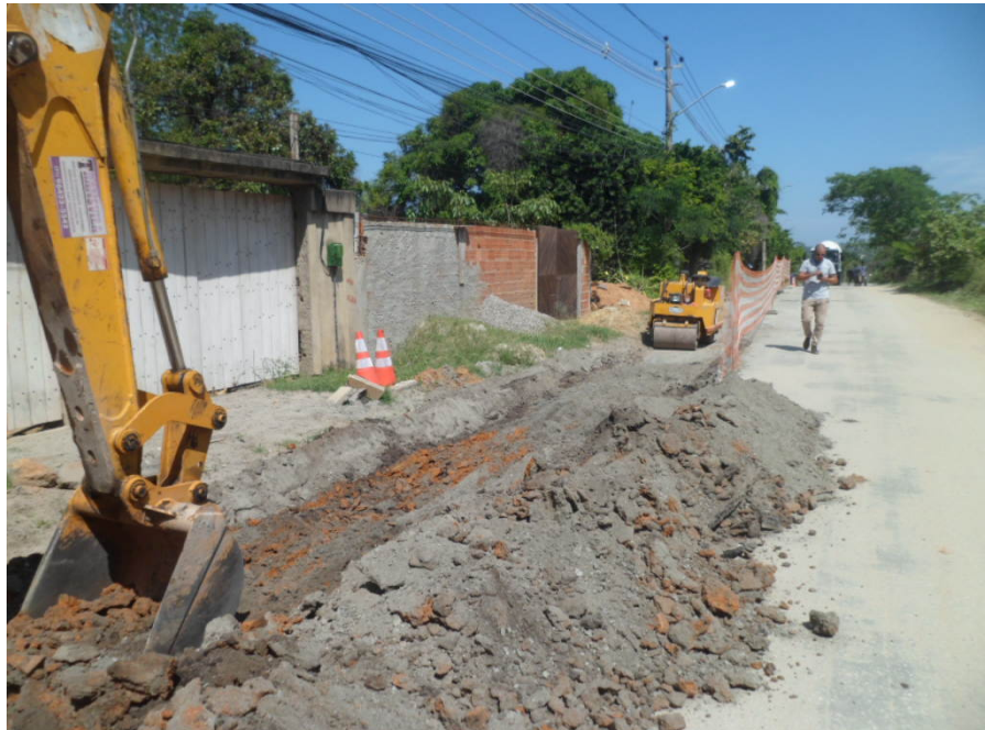
Foto 12 – Estrada da Capoeira Grande (Obras de Instalação de Tubulações)

Governo do Estado do Rio de Janeiro Secretaria de Estado de Desenvolvimento Econômico, Emprego e Relações Internacionais Agência Reguladora de Energia e Saneamento Básico do Estado do Rio de Janeiro