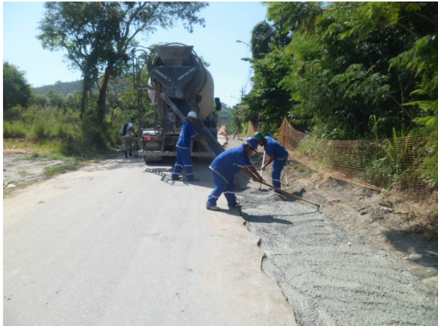
Foto 14 – Estrada da Capoeira Grande (Equipe da CEDAE Concretando Trecho já Concluído)

Governo do Estado do Rio de Janeiro Secretaria de Estado de Desenvolvimento Econômico, Emprego e Relações Internacionais Agência Reguladora de Energia e Saneamento Básico do Estado do Rio de Janeiro