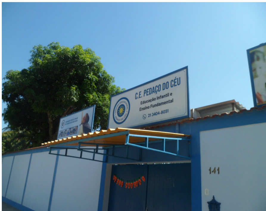
Foto 02 – Entrada da Capoeira Grande, 141 – C.E.Pedaço do Céu – Pedra de Guaratiba

Governo do Estado do Rio de Janeiro Secretaria de Estado de Desenvolvimento Econômico, Emprego e Relações Internacionais Agência Reguladora de Energia e Saneamento Básico do Estado do Rio de Janeiro