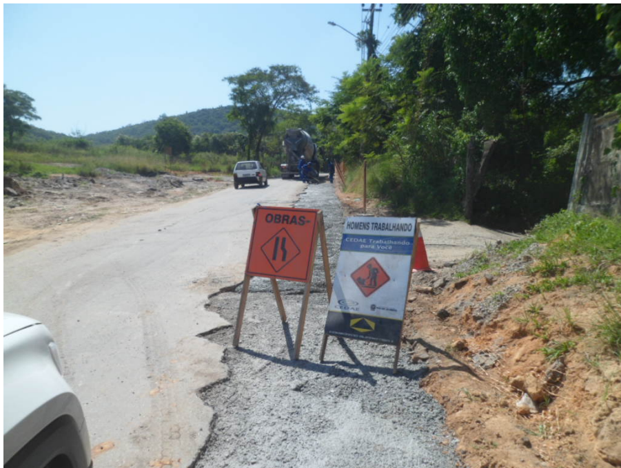
Foto 13 – Estrada da Capoeira Grande (Obras de Restauração da Via)