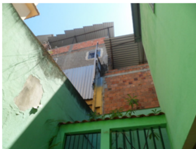
Foto 08 – Comunidade Costa e Silva, Construída atrás da residência